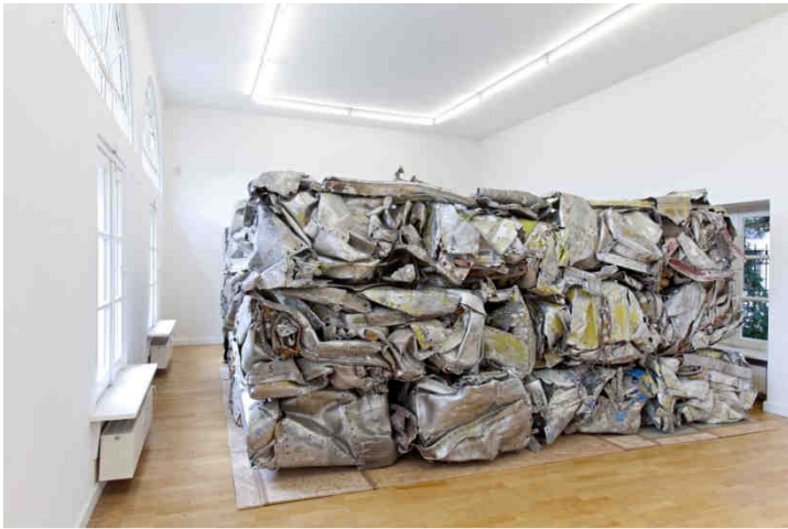
Fernando Sánchez Castillo Guernica Syndrome , 2012 Installationsansicht Kunstverein Braunschweig

Kunstverein Braunschweig (Remise) 16. Juni - 26. August 2012