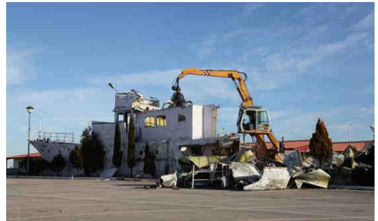
Fernando Sánchez Castillo Guernica Syndrome , 2012 (Filmstill) Video, Farbe, 31:17 min