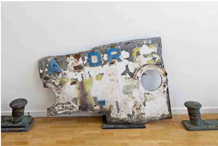
Fernando Sánchez Castillo Guernica Syndrome , 2012 Installationsansicht Kunstverein Braunschweig