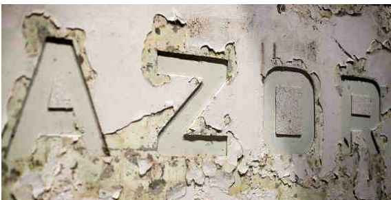
Fernando Sánchez Castillo Guernica Syndrome , 2012 Installationsansicht Matadero Madrid